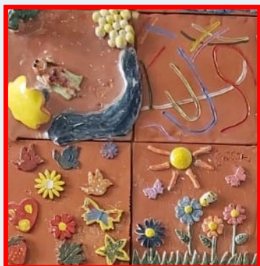
Il mondo. Particolare. Progetto Thun di ceramico-terapia. O. Microcitemico CA

La proposta progettuale dell'Istituto Comprensivo Su Planu, Scuola Polo per la Formazione SiO/ID, è orientata alla predisposizione di un Piano di Formazione per i docenti attraverso la creazione di una Rete che coinvolga la Scuola pubblica, le Aziende Ospedaliere, l'Università. Il Piano per il 2019 prevede l'individuazione e la formazione di un Referente per l'Istruzione Domiciliare e per i contatti con le Scuole in Ospedale per ogni Istituzione Scolastica della Sardegna. Sono stati predisposti due corsi, a Cagliari e Terralba (OR).